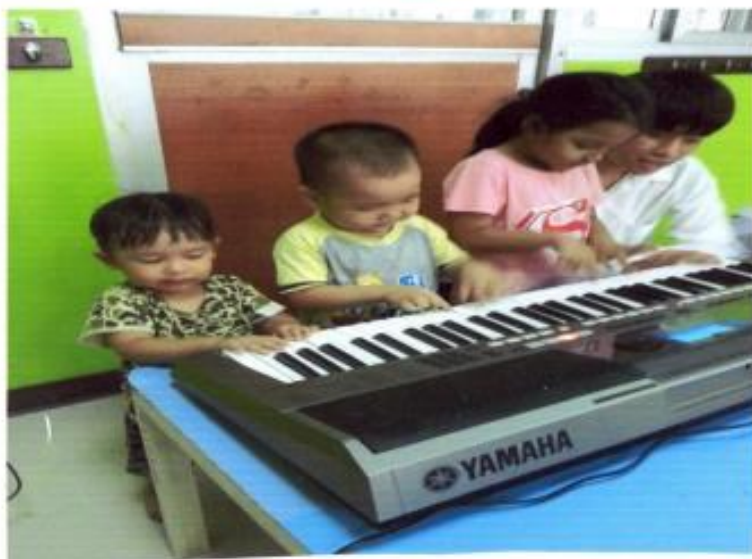
โครงการปิ่นรักให้น้อง

ทำที่โรงพยาบาลพระมงกุฎ วันที่ 4 เมษายน 2559 ถึงวันที่ 7 เมษายน 2559